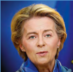
URSULA VON DER LEYEN wird nun Greenwashing vorgeworfen. Die neuen Regeln für nachhaltiges Investieren stammen nicht von Wissenschaftlern.

Die EU hat definiert, was klimafreundlich ist und was nicht. Eine Entscheidung, die für viele Unternehmen enorme Bedeutung hat. Heimische Kanzleien gründen nun sogar EIGENE RECHTSABTEILUNGEN , die sich speziell mit dem Thema Nachhaltigkeit befassen.