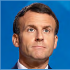
EMMANUEL MACRON hat die Interessen der Atomlobby in Brüssel durchgebracht. Atomstrom gilt noch immer als nachhaltige Energiequelle.